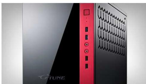
前面 I/O ポート : USB3.0×2、USB2.0×2

また、さまざまな外付けデバイスに対応可能な複数の I/O ポートを持ち、高速なデータ転送を可能とする USB3.1ポートを Type-A 形状と Type-C 形状で各1ポート（背面×2）搭載しています。また、VR デバイスなどの接続に使用される USB3.0ポートを Type-A 形状で6ポート（前面×2、背面×4）、旧来の周辺機器に採用が多い、USB2.0ポートも2ポート（前面×2）、それぞれ搭載しており、レガシーな周辺機器にも対応する柔軟性を備えています。