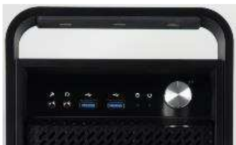
前面 I/O ポート USB3.0×2 / ステレオミニジャック

また、制作環境におけるスタジオ内での持ち上げ・移動を便利にする標準装備のハンドルに加えて、耐久性の高いボールベアリングを採用した専用キャスターも標準装備しており、スムーズな移動を可能にします。