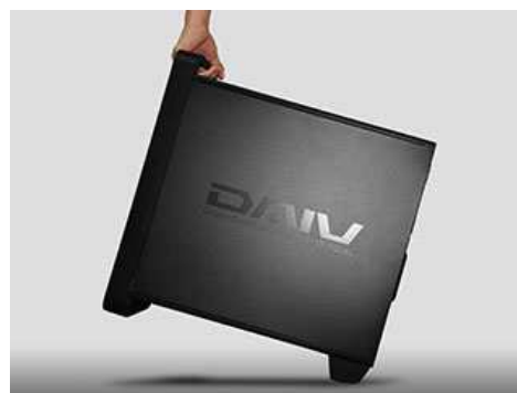
ハンドル・キャスター使用イメージ